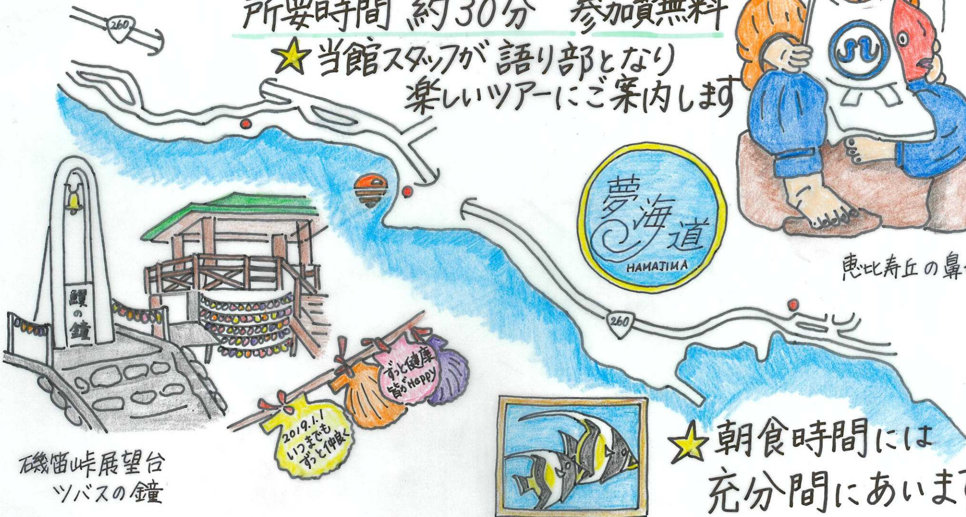
磯笛峠展望台 ツバスの鐘